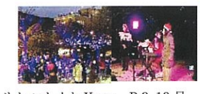
リトルナイト Xmas R3.12 月