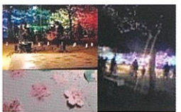
庚午 YOZAKURA R4.4 月 第一公園夜