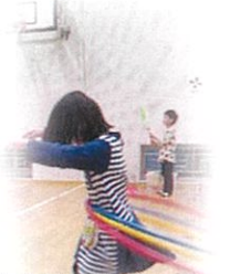
できた！見て見て！ 嬉しさを共有