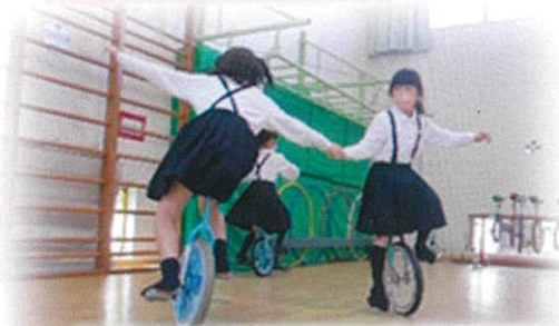
練習して友だちと一緒に楽しめるようにも