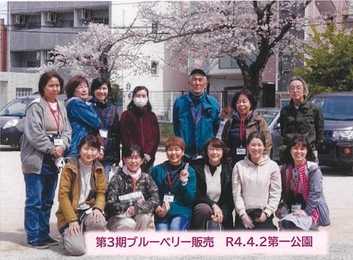
第3期ブルーベリー販売 R4.4.2第一公園

150 年を記念して 150 鉢のブルーベリーを 3 年かけて販売 今年度はブルーベリーが庚午の木として根付くようにプレートも作成しました↓