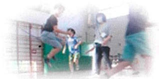
先生が見守る中、安心して遊べる