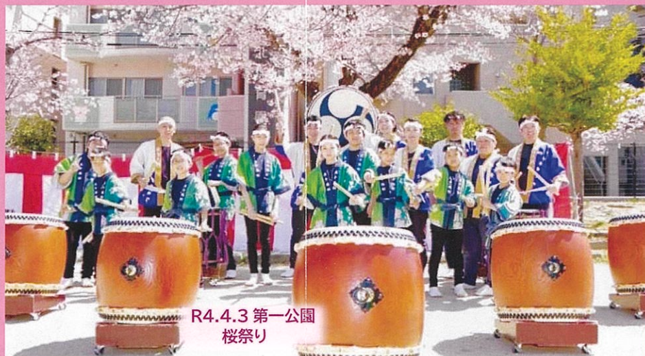
R4.4.3 第一公園 桜祭り