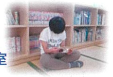
独りがいい時もあるよね