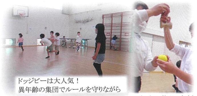
ドッジビーは大人気！ 異年齢の集団でルールを守りながら