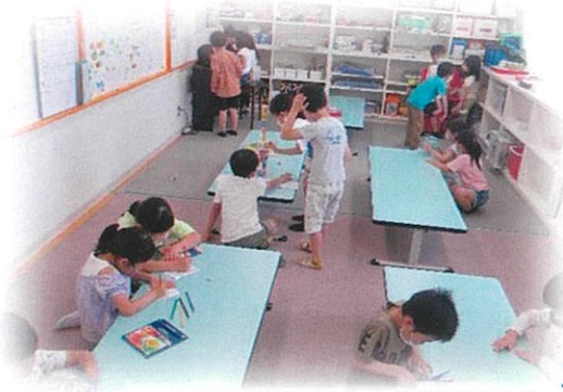
コロナ禍では決められた遊びの中から 自分で選んで楽しんでいます。